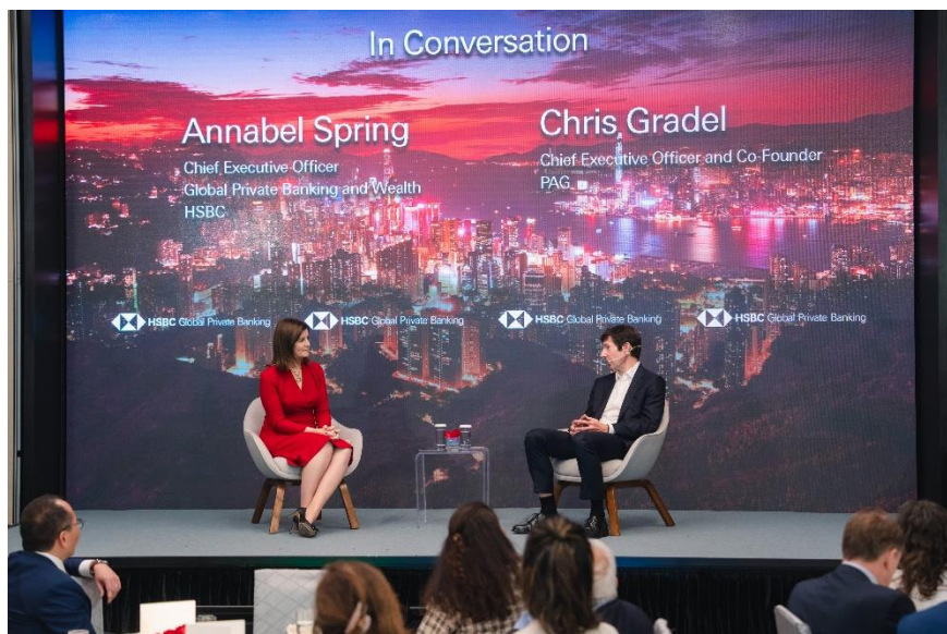
照片 3：(左)滙豐環球私人銀行及財富管理行政總裁詩文慧與(右)太盟投資集團聯合創辦人及首席執行官高天樂的專題探討。