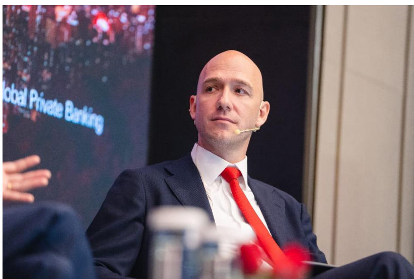
照片 2：滙豐環球私人銀行及財富管理另類投資部環球及亞太區主管馬修就私募市場發展前景發表評論。